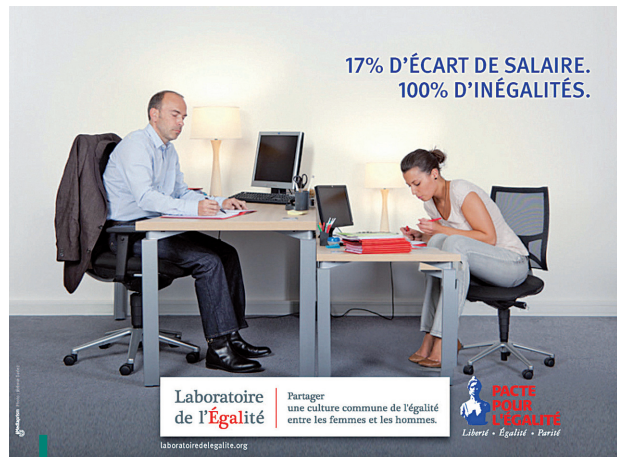
Affiche du Laboratoire de l'égalité, 2012.